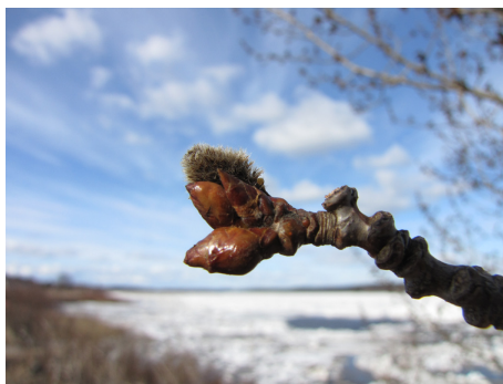
Islossningen är för många en avlägsen, exotisk dröm. Vi som bor i Övertorneå kommun behöver inte drömma, den finns fortfarande där med alla vårens tecken. Men den visar också tecken på att vi måste ändra vårt sätt att leva för att den ska finnas kvar.

Eller som en kvinna lyriskt uttryckte det "Tänk att jag bor där andra väljer att ha sin sommarstuga!".