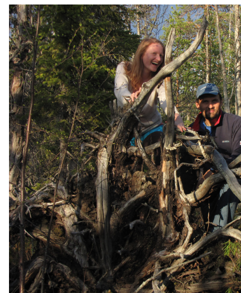
Vänner, inte turister. Kreativa människor som kan skapa sin egen nisch var helst i världen, men ännu inte har tänkt tanken att flytta till Övertorneå ekokommun.

... och blir det ingen flytt till vår kommun kanske det blir någon annanstans och blir det inte någon flytt alls så kanske det finns vänskap för livet.