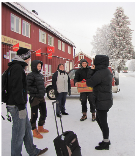
Att prata utanför byaffären i väntan på bussen kräver inget finansiellt kapital. Däremot ökar det sociala kapitalet.

Det fantastiska med både det humana kapitalet och det sociala är att det förmeras ju mer man använder sig av det!